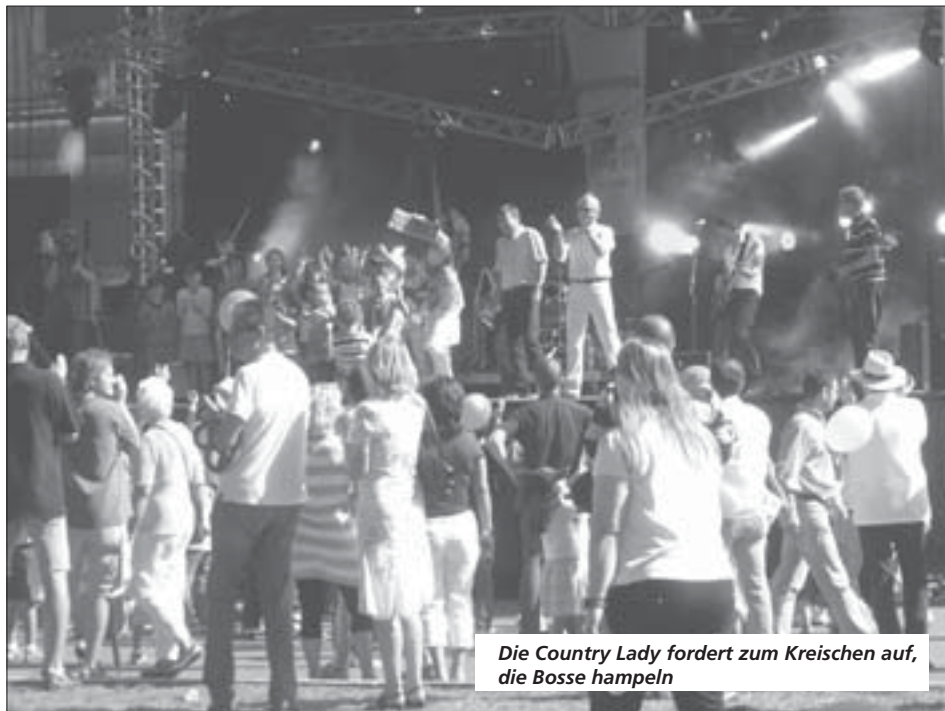
Die Country Lady fordert zum Kreischen auf, die Bosse hampeln

Ausgestattet mit Shirts und Kappen, werden die Jubelgäste zu Multiplikatoren, die das Werbekonzept „MAN das sind wir!“ raustragen. Millionen Euro sind in diesem Fest also gut angelegt. LKW als Rennsemmeln mit 1.500 PS, LKW für die Wüstenrallye Dakar, eine Flughafen-