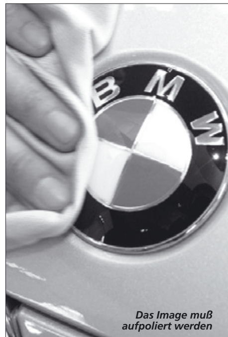
Das Image muß aufpoliert werden

Die Geschäftsleitung versteht nur die Sprache des offenen Protests. Beim Streik-