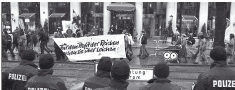
Massives Polizeiaufgebot schützt die Kriegstreiber - ganze Straßenzüge werden abgeriegelt, damit die Herrschaften ungestört tagen können.

Die ökonomische Abhängigkeit ist weit gediehen: EON und RWE bestimmen den osteuropäischen Energiemarkt, deutsche Banken kontrollieren die Kapitalströme, Metro und REWE füllen die Läden und deutsche Verlage bilden über die Zeitungen die herrschende Meinung.