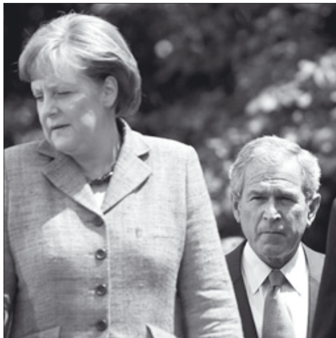
George W. Bush, im Schlepptau von Kanzlerin Merkel während des G8-Gipfels 2007 in Heiligendamm?

Fortsetzung von Seite 1 44. SICHERHEITSKONFERENZ 2008