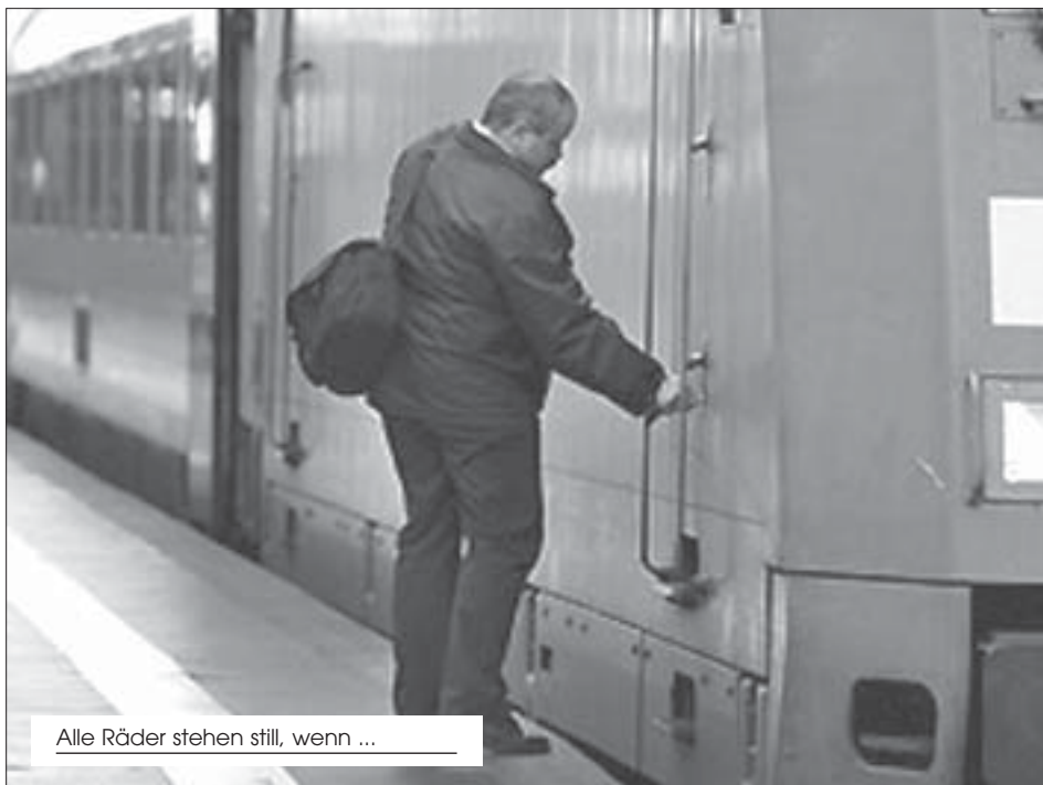
Alle Räder stehen still, wenn ...