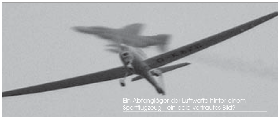
Ein Abfangjäger der Luftwaffe hinter einem Sportflugzeug - ein bald vertrautes Bild?

nötigen Freiheiten im Kampf gegen den Terrorismus bieten“, so der Innenminister 1 . Schäuble wolle den politischen Mord legalisieren, meinte dazu die stellvertretende Vorsitzende der FDP-Fraktion Leutheusser-Schnarrenberger. 2 Diese „Denkanstöße“ gingen dann wohl doch (noch) etwas zu weit - weg sind sie damit nicht. Denken wir nur an die Forderung, Bundeswehr im Inneren einzusetzen. Diesen Denkanstoß brachte Schäuble schon vor 15 Jahren, als er noch Innenminister unter Kohl war. Von „islamischen Terroristen“ war damals in diesem Land weit und breit nichts zu sehen. Tatsächlich eingesetzt wurde die Bundeswehr verfassungswidrig in diesem Jahr gegen die Demonstranten in Heiligendamm, die anlässlich des G-8 Gipfels gegen die Mächtigen dieser Welt protestierten. Tornados flogen im Tiefflug über die Camps der Demoteilnehmer zur Aufklärung. Ein weiterer Minister dieser Regierung, Kriegsminister Jung, verkündigte kürzlich laut, dass er sich einen Dreck um die Verfassung kümmert und gekaperete Flugzeuge abschießen lassen will. Das Bundesverfassungsgericht hatte dies erst vor einem Jahr ausdrücklich verboten.