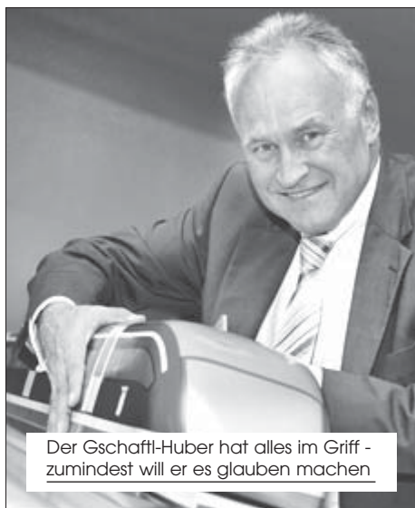
Der Gschaffl-Huber hat alles im Griff - zumindest will er es glauben machen

Alle 5 Minuten donnert er durchs Olympiadorf, um die Anwohner mit einem knallartigen Lärm von der Größenordnung mehrerer LKW zu überziehen.