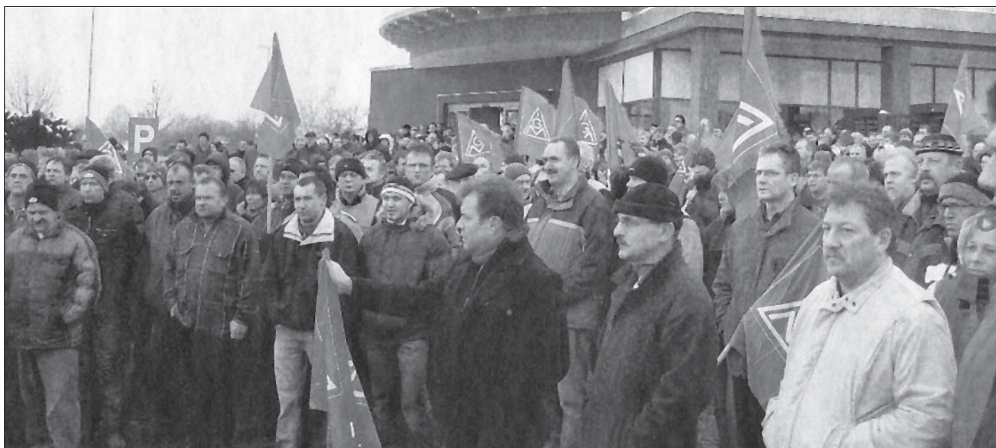
Sie haben einen Betriebsrat notwendiger denn je, Mitarbeiter bei Siemens im unterfränkischen Bad Neustadt

Es stammt aus der Bauhaus-Marktkette, könnte aber dem Wortschatz so mancher Managers entnommen sein. Es soll ausdrücken, dass es eine Seuche sei, für die Interessen der abhängig Beschäftigten einzutreten. In diesem Sinne, Kolleginnen und Kollegen: Verseucht die Festungen des Kapitals - wählt Eure Betriebsräte!