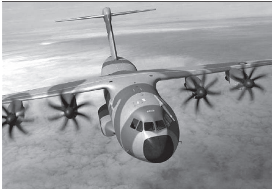
Scheitert der A400M? Na und?