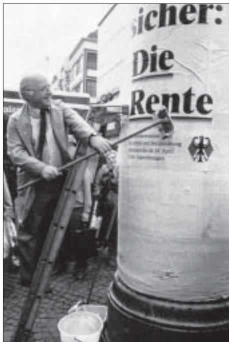
Eines ist sicher: „Die Rente ... schrumpft!“

gung, die als Ergänzung zweitens eine Betriebsrente und drittens private Vorsorge benötigt, um im Alter über die Runden zu kommen.