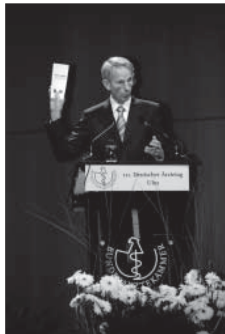
Hoppe auf dem Ärztetag

Sparen könnte man an vielem im Gesundheitswesen, z. B. an den überhöhten Preisen für Medikamente (im Ausland bekommt man oft das gleiche Medikament für einen Bruchteil des Preises) - da hört man von den Ärztefunktionären nichts. Aufgrund des finanziellen Interesses vieler Fachärzte an der Auslastung ihrer Geräte wird in Deutschland vielfach öfter geröntgt als in andern europäischen Ländern. Sparen könnte man auch an der Doppelstruktur von Fachärzten und Kliniken. Andere Länder halten ein System von