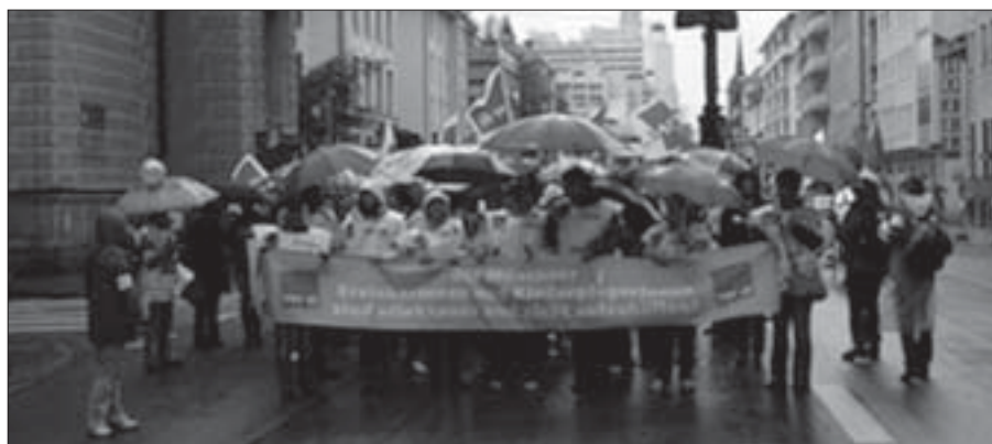
2.500 Erzieherinnen streikten am 23. Juni den ganzen Tag. Sie versammelten sich nahe der Schwanthaler Höhe vor dem Haus des Kommunalen Arbeitgeberverbands. Dieser hatte in den Tarifverhandlungen zur Gesundheitsförderung und zur Entlohnung der Beschäftigten im Sozial- und Erziehungsbereich kein Angebot vorgelegt, das auch nur annähernd die Kernforderungen der Beschäftigten erfüllt. Die Kolleginnen zogen zum Marienplatz, das Wetter war schlecht, die Stimmung war ausgezeichnet.

brauchen unsere Rechte. Verteidigen und immer wieder erkämpfen können wir sie nur, wenn wir sie auch nutzen. Laut und massenhaft. ●gr