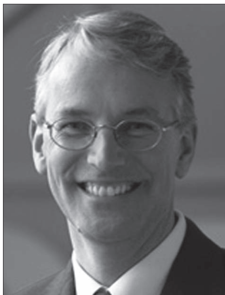
Nur strahlende Gesichter: Océ-Chef Iperen (links im Bild) und Besucher aus dem Fernen Osten am dem Tag der offenen Tür.