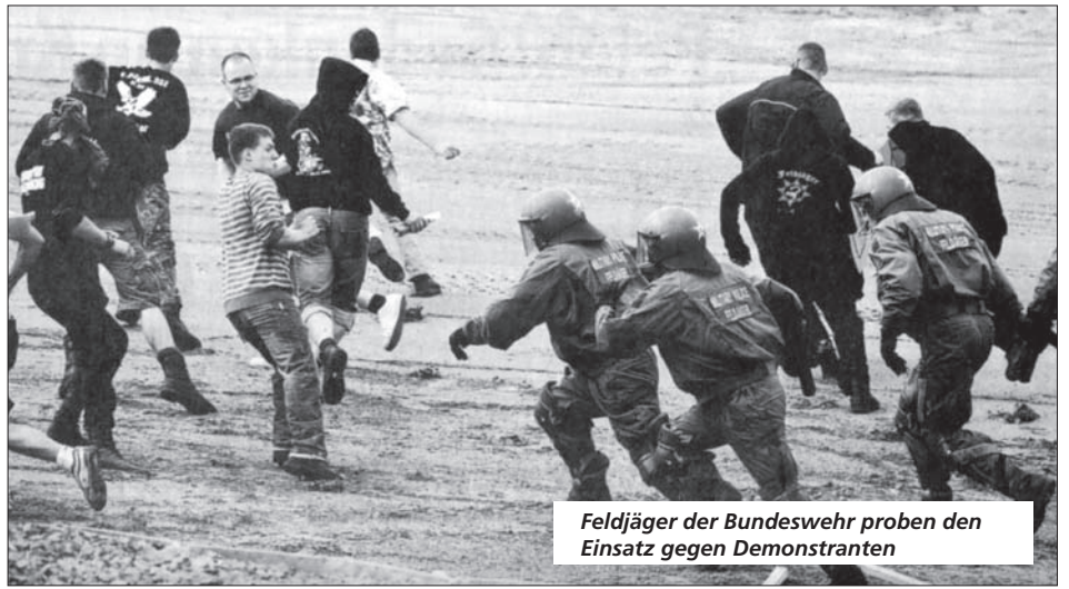
Feldjäger der Bundeswehr proben den Einsatz gegen Demonstranten

Bereits in Heiligendamm wurde die Bundeswehr gegen Demonstranten eingesetzt, die gegen den G-8-Gipfel protestierten. Die Planungen der Bundeswehr gehen aber offensichtlich noch weiter: Bei der Übung „Hoher Franke II“ in Schwarzenbach am Wald am 3.11.09 wurden bereits bürgerkriegsähnliche Zustände zugrunde gelegt und dabei demonstrierende Friedensaktivisten bekämpft, die gegen den Afghanistankrieg protestierten. Außerdem wurde die Verteidigung einer Radarstation gegen schwer bewaffnete „Terroristen“ trainiert. (Bei vorigen Übungen hatten die „Terroristen“ übrigens Blaumänner an!) Dargestellt wurden diese von Reservisten, die so in die Übungen der Bundeswehr integriert werden sollen.