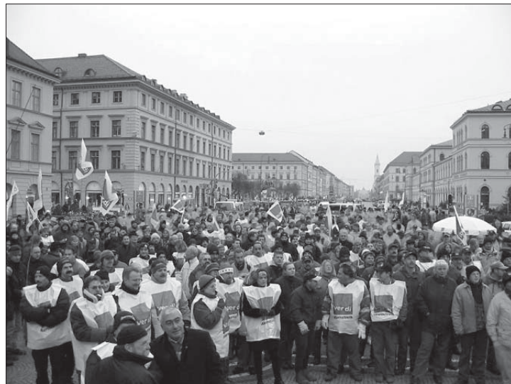
Odeonsplatz am 10. Dezember 2002: 1.200 Kolleginnen und Kollegen verschiedener städtischer Betriebe beim Warnstreik

Das Verhandlungsergebnis und die Zustimmung unserer gewählten und angestellten (bezahlten) Funktionäre ist eine Zumutung für die Basis und alle Vertrauensleute, die nun alle Hände voll zu tun haben, die Scherben ein zu sammeln und zu kitteln. Das wird nicht in jedem Fall gelingen und die ohnehin nicht leichte Gewerkschaftsarbeit in Verwaltung, Betrieb und Behörden noch mehr erschweren. Viele Mitglieder der Tarifkommissionen sind Personalrats- und Betriebsvorsitzende. Immer öfter stelle ich mir die Frage: Reden diese nicht mehr mit ihren KollegInnen, kennen sie die Stimmung an der Basis überhaupt noch. Oder bekommt man kraft Amt den besseren Über- bzw. Durchblick, den wir Vertrauensleute und normale Mitglieder selbstverständlich nicht haben können? Trübt der tagtägliche Umgang mit Politikern gleich welcher Partei, Verwaltungs- und Behördenleitern die klare Sicht auf die tatsächlichen Probleme und Nöte der KollegInnen. Verwässert das Verständnis für die „Nöte“ der öffentlichen Ar-