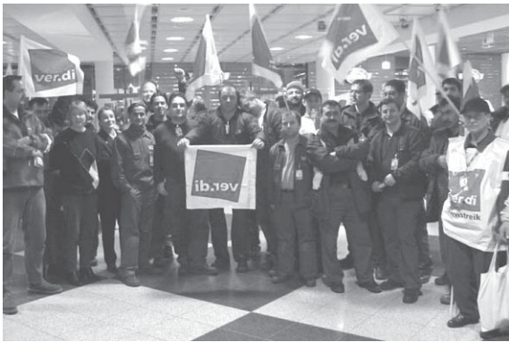
Flughafen am 17. Dezember 2002: 6 Stunden Warnstreik der Kollegen von Feuerwehr und Bodendienst