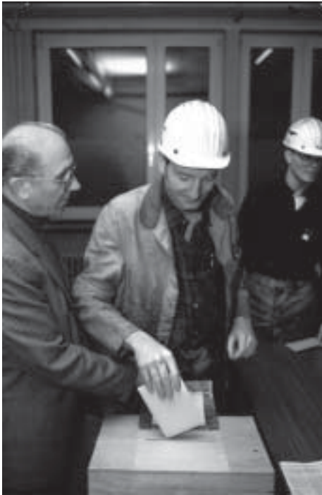
Zur Urabstimmung auch in Bayern schreiten