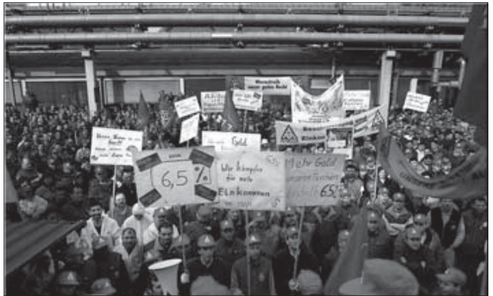
MAN, 10.4. und 18.4