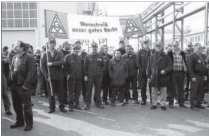
Kraus Maffei, 11.4 und 15.4.