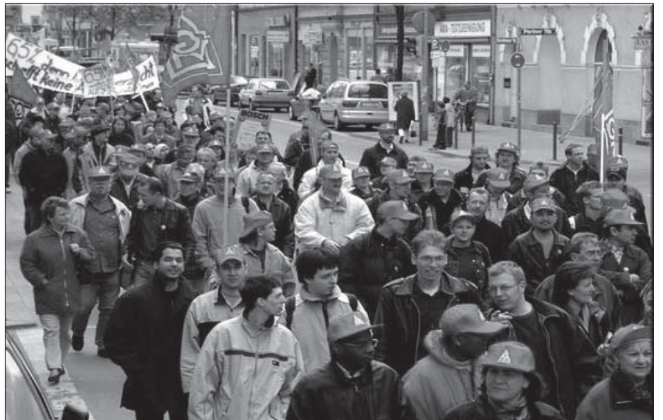
Die Betriebe im Münchner Osten, 17.4