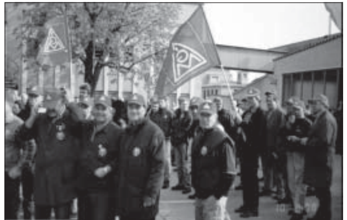
Knorr Bremse 13.4.