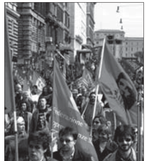
Nach über 20 Jahren wieder Generalstreik in Italien, hier in Rom am 16. April

Selbst in der vom Minister der faschistischen AN kontrollierten staatlichen Rundfunk- und Fernsehanstalt RAI beteiligte sich ein Teil der Journalisten am