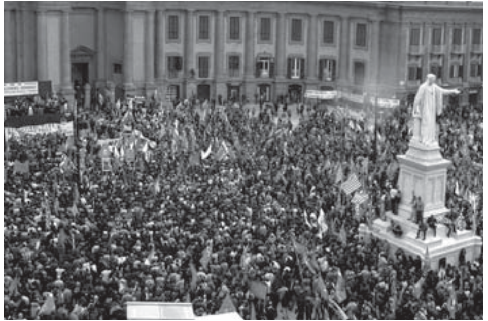
Ebenfalls am 16. April in Neapel, aufgerufen von allen Gewerkschaften des Landes

An den Kundgebungen nahmen Richter und Staatsanwälte teil, die dagegen protestierten, dass Berlusconi die Justiz der