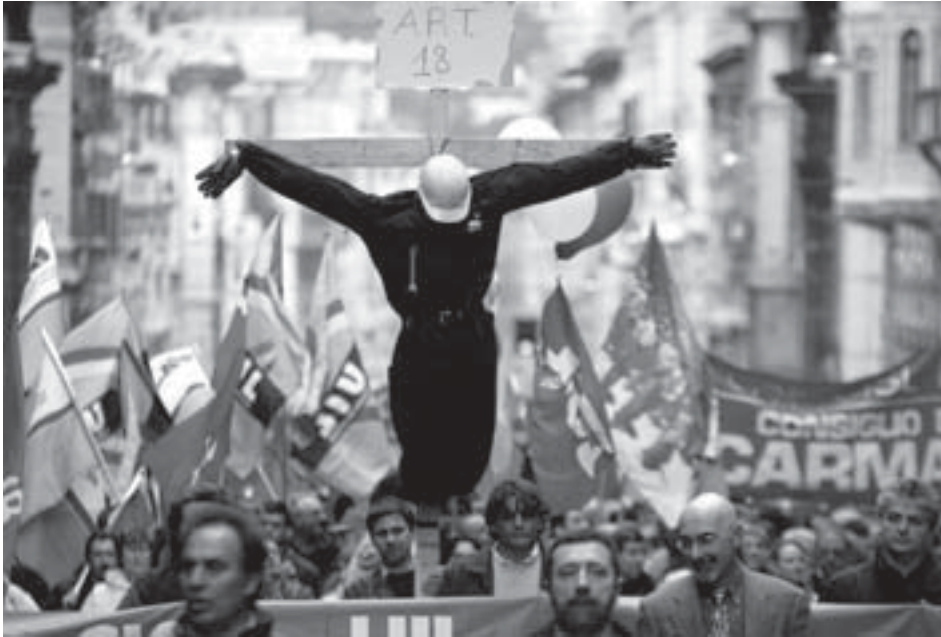
Am 16. April marschieren tausende durch die Strassen von Genua, mit roten Fahnen, Transparenten und einen von der Regierung Berlusconi an das Kreuz genagelten Arbeiter

ler, Schriftsteller, Künstler, Schüler und Studenten, Lehrer solidarisieren. Einen nachhaltigen Anstoß hatte der Theaterregisseur und Nobelpreisträger Dario Fo gegeben, der im Januar in einem stark beachteten Vortrag vor einer „Etablierung des Faschismus“ warnte und zur antifaschistischen Aktionseinheit mahnte.